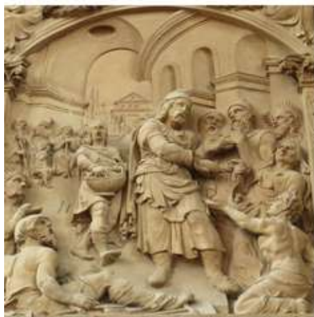
Trierer Dom